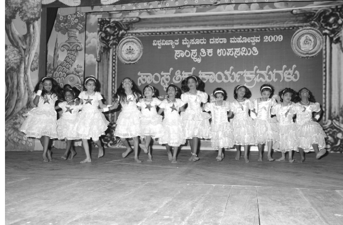
ಬಾನಿನಲ್ಲಿ ಮೂಡಿಬಂದ ಚಂದಮಾಮ ಗೀತೆಗೆ ನೃತ್ಯ